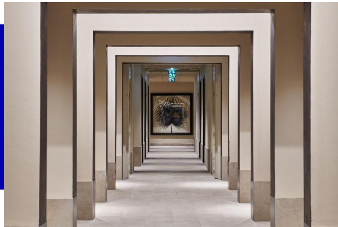
Spa Splendid Dax****

Avec l'arrivée de la nouvelle année, il est temps de faire une pause et de prendre soin de soi. Entre les résolutions à tenir et le rythme effréné du quotidien, le début d'année est le moment idéal pour s'offrir un instant de calme et de renouveau. Que vous soyez en quête de sérénité, de bien-être ou d'une simple échappée, Vacances Bleues propose des adresses d'exception pour entamer 2025 sous le signe de la douceur et du ressourcement. En voici une sélection :